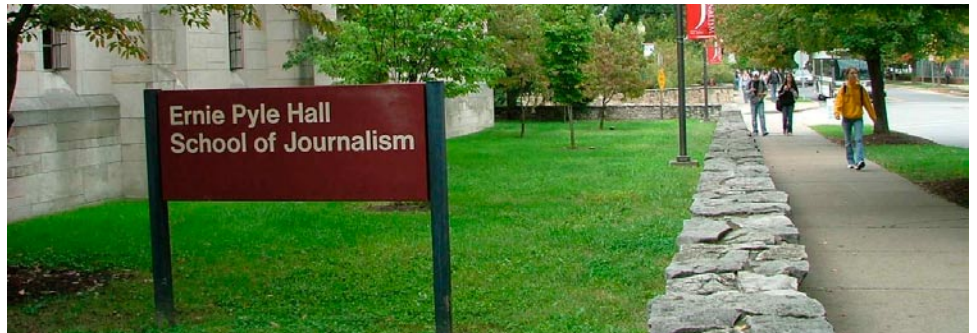
School of Journalism, University of Indiana, Bloomington, USA.