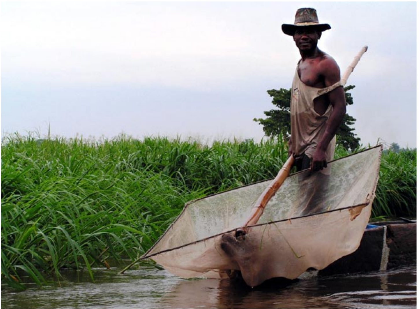
Early in the morning a fisherman (pêcheur) tests the water in the middle of the River Congo near Mbandaka, a town just north of the equator in the DRC.