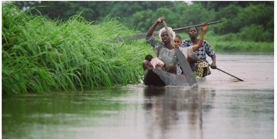
Three women and two babies travel on the River Congo near Mbandaka, just north of the equator in the DRC, in a pirogue (dugout), a traditional canoe, tens of thousands of which are used to transport people and goods on Africa's second longest river.

The cargo that fed his enterprise was transported almost exclusively along this river, which Francophone locals insist is not merely a rivi re (there are hundreds